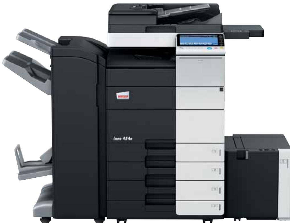
ineo 454e mit Heft- und Broschüren- finisher (FS-534SD), Papierkassette (PC-210), Großraumkassette (LU-301) und Ablagetisch (WT-506)

Jedes dieser Multifunktionssysteme – ineo 224e, ineo 284e, ineo 364e, ineo 454e und ineo 554e – ist einfach zu bedienen und hat eine große Bandbreite zusätzlicher Funktionen, die die tägliche Arbeit im Büro entscheidend erleichtern. Wenn beim Drucken, Kopieren und Scannen Zeit gespart wird, bleibt mehr Zeit für die eigentlichen Kernaufgaben – und das steigert die Produktivität im Büro.